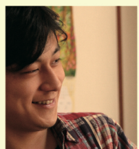
監督・脚本 中川龍太郎

ヒスイ海岸の国道8号沿いに、郷土食のタラ汁を提供するお店や民宿がズラリと並ぶ。タラ汁は、中川監督と撮影スタッフの大好物。夏場の過酷なロケの間、ドライブインきんかいが、毎日ロケ弁を提供してくれた。