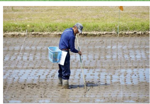
3.設計図をもとに下絵を描く