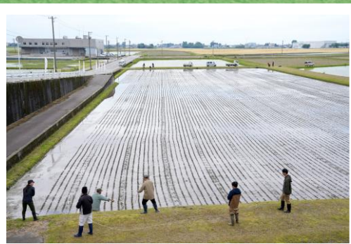
2.ロープを張り2.5m角のマス目を作る