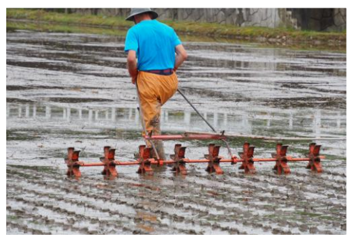
1.ころがしで苗を植える目印をつける