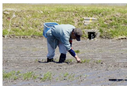
4.輪郭線として濃紫稲を植える