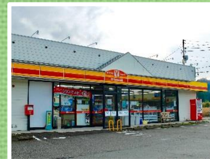
ヤマザキショップ境店