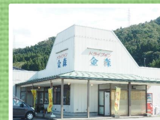
ドライブイン金森