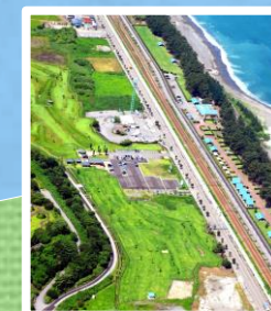
朝日ヒスイ海岸 オートキャンプ場