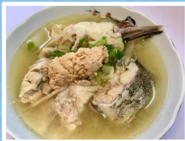
ヒスイ海岸名物タラ汁