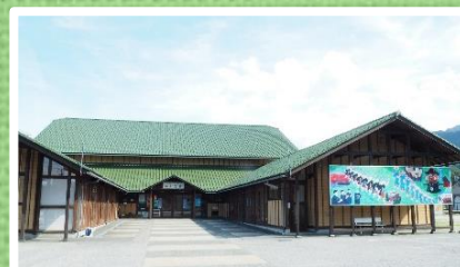
カルチャーセンターみやざき