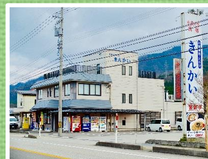
ドライブインきんかい